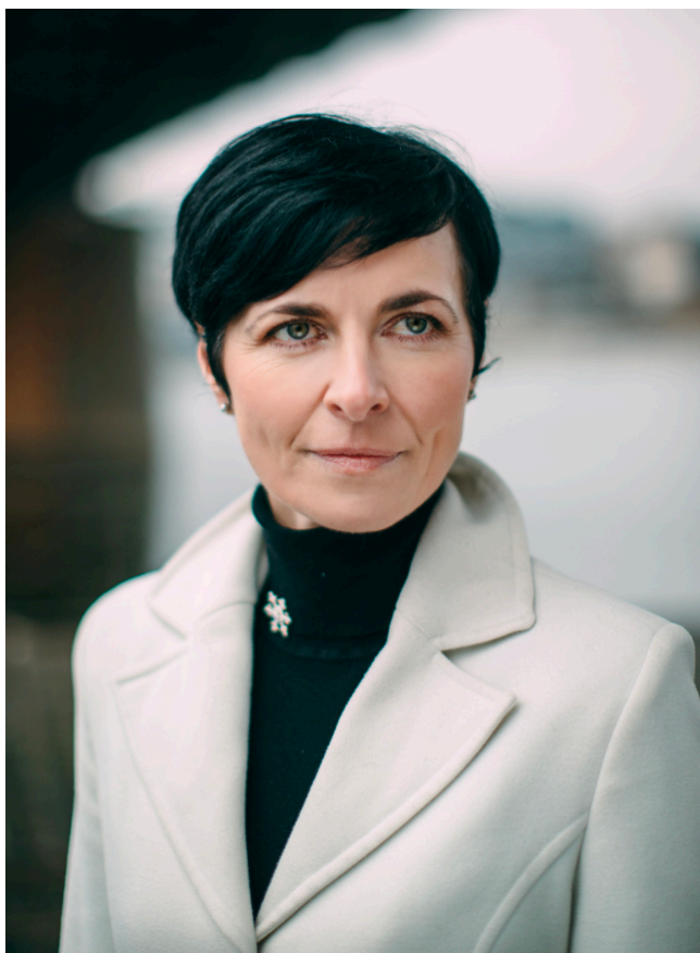
JUDr. Lenka Bradáčová, Ph.D. Nejvyšší státní zástupkyně

Podle statistických dat došlo například v letech 2022 až 2024 k trestnímu stíhání 346 fyzických osob pro trestný čin poškození věřitele, což odpovídá úrovním trestných činů pojistného podvodu (310 fyzických osob) nebo zkreslování údajů o stavu hospodaření a jmění (371 fyzických osob) za shodné období. Statisticky by určitý deficit bylo možné sledovat u trestného činu způsobení úpadku, kde bylo v letech 2022 až 2024 stíháno celkem 11 osob. Pokud se jedná o druhou část otázky, pak je třeba se legitimně dotazovat, jakou